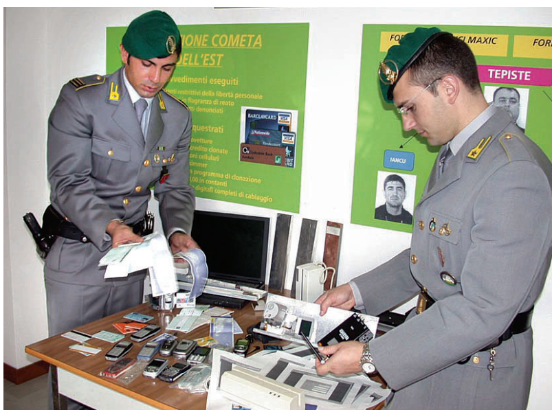
Gli uomini della Guardia di finanza mostrano tutto il materiale sequestrato sul litorale romano alla banda di clonatori di bancomat e carte di credito

Considerarli dei truffatori è davvero poco. Quattro mesi di indagini, centinaia di pedinamenti, appuntamenti, intercettazioni da brivido e persino riprese video davanti gli istituti di credito. Al pubblico ministero della Procura di Roma, Giorgio Orano, non è restato altro che firmare le prime ordinanze di custodia cautelare in carcere. I finanzieri di Ostia l'hanno chiamata «Cometa dell'est»: l'operazione che ha scardinato una holding italo-romena specializzata nella clonazione delle schede magnetiche emesse dai principali istituti di credito: dall'American Express a Visa, MasterCard, Diners, CartaSi. «L'indagine è stata avviata - spiega il tenente colonnello Pierluigi Sozzo, comandante del II Gruppo Roma delle Fiamme gialle - seguendo i movimenti di